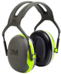
X4A Arnés sobre la Cabeza (234 g.)