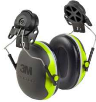
X4P3E Arnés para casco (236 g.)