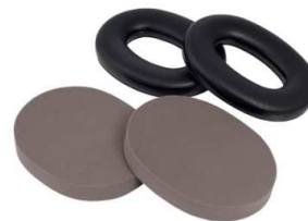
Kit de Higiene HYX4

3M pone a su disposición el Kit de Higiene HYX4, el cual le permitirá cambiar de manera rápida las almohadillas de los fonos si ellas presentan roturas, pliegues, deformaciones permanentes o rigidez en su parte exterior, sin que ello implique cambiar la unidad completa.