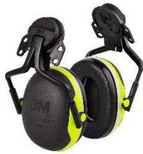
X4P5E Arnés con Aislamiento Eléctrico Para Casco (235 g.)