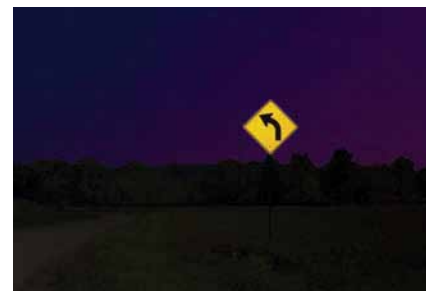
Para cubrir sus necesidades de señalización