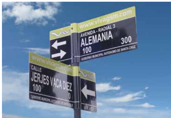
Señalización Avenidas en Santa Cruz - Bolivia

Alta performance, equilibrio costo / beneficio