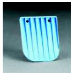
7583 Válvula de exhalación