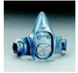
7586 Soporte de filtros